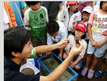
特徴と生態の説明