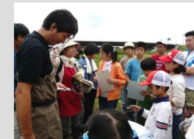
今後の活動支援のお願い