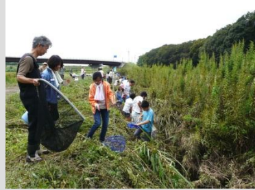
サデ網・玉網を使って