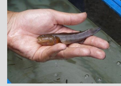
特大サイズのヌマチチブ