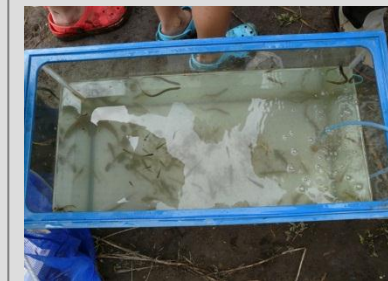
救出した水生生物

■日時: 9月23・24日 (掲載写真は23日のみ) ■場所: 亀成川上流(宗甫) ■参加者: 小学生の親子 * ニュータウン開発に伴う治水対策のため亀成川の大改修工事が実施されるので、魚や貝、水生昆虫、カエルなどの生きものを救出しました。