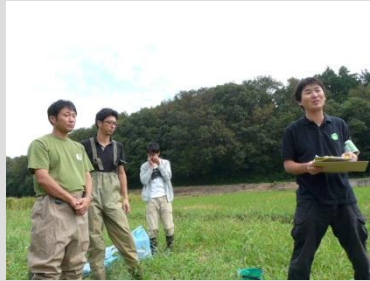
水生生物の専門家スタッフ

■日時: 9月23・24日 (掲載写真は23日のみ) ■場所: 亀成川上流(宗甫) ■参加者: 小学生の親子 * ニュータウン開発に伴う治水対策のため亀成川の大改修工事が実施されるので、魚や貝、水生昆虫、カエルなどの生きものを救出しました。