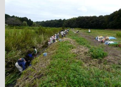
川の中は大賑わい