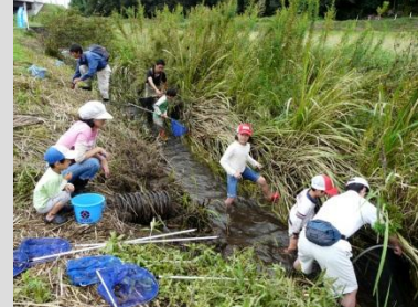
大人も子どもがサガサ