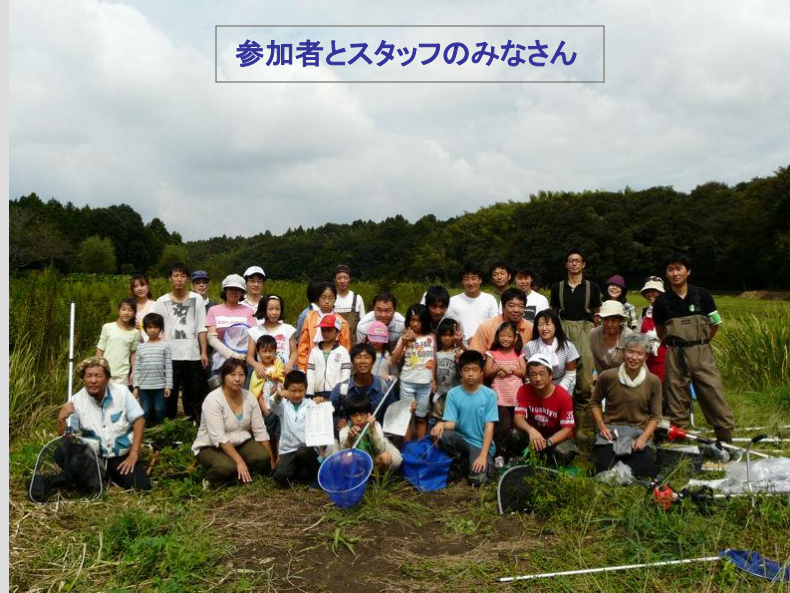
参加者とスタッフのみなさん