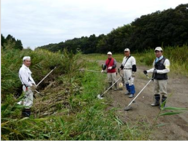
草刈りのボランティア